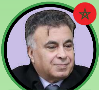
Pr Zahreddine TAYBI