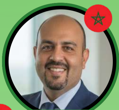
Pr Imad KHATER