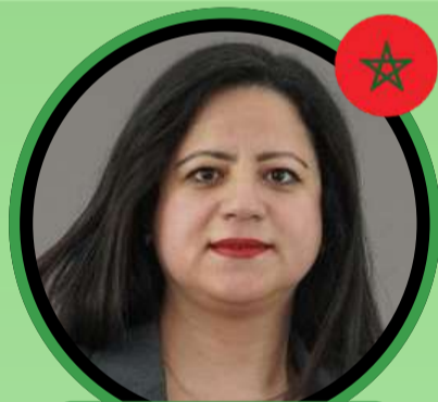
Pr Ghizlane EL AIDOUNI