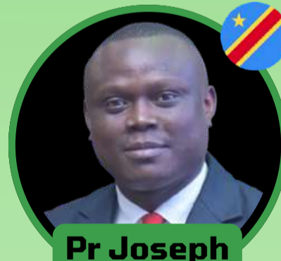
Pr Joseph MOTO KOSARADE