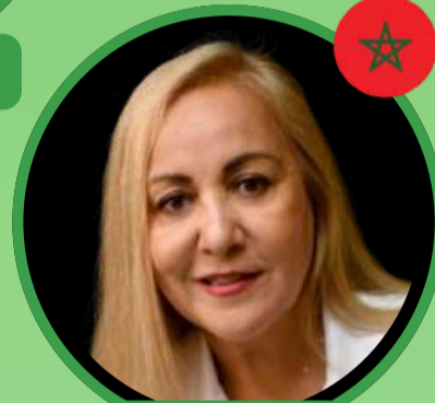
Pr Amal BOURQUIA